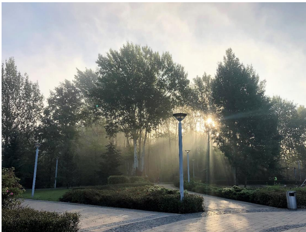
Poranna mgła.

Najbliższy tydzień zapowiada się pod znakiem pogody ze zmiennym zachmurzeniem (od bezchmurnego nieba po zachmurzenie całkowite), z nocnymi i porannymi mgłami oraz okresami z opadami deszczu. Będzie ciepło; na początku tygodnia temperatura powietrza wzrośnie do 20°C, by w piątek obniżyć się do 12°C a w weekend ponownie wzrosnąć do 15°C.