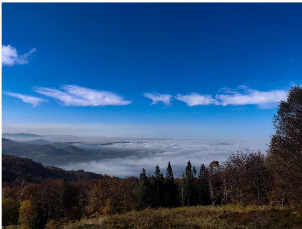
Beskid Śląski.

Kraków 10°C Kielce 9°C Rzeszów 10°C Zakopane 6°C