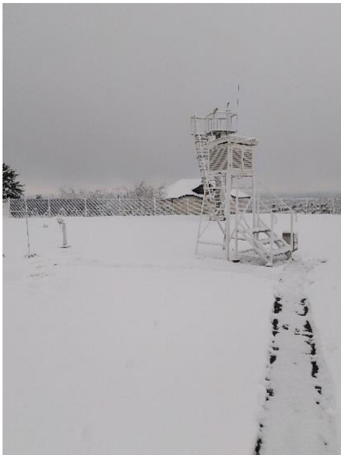
Śnieżny poranek 29.11.2020 na SHM Krosno.

We wtorek nieco więcej słońca w centrum i na południu kraju, na pozostałym obszarze nadal pochmurno i gdzieś słaby deszcz ze śniegiem, na Podlasiu śnieg. Temperatura w dzień wyniesie od -3^{\circ}\text{C} na południowym wschodzie, około 2^{\circ}\text{C} w centrum do 4^{\circ}\text{C} na północnym zachodzie. Nocą nadal zimno, nawet do -7^{\circ}\text{C} na wschodzie kraju , nad morzem około 0^{\circ}\text{C} . Wiatr słaby i umiarkowany, w górach okresami porywisty, południowo-zachodni i południowy.