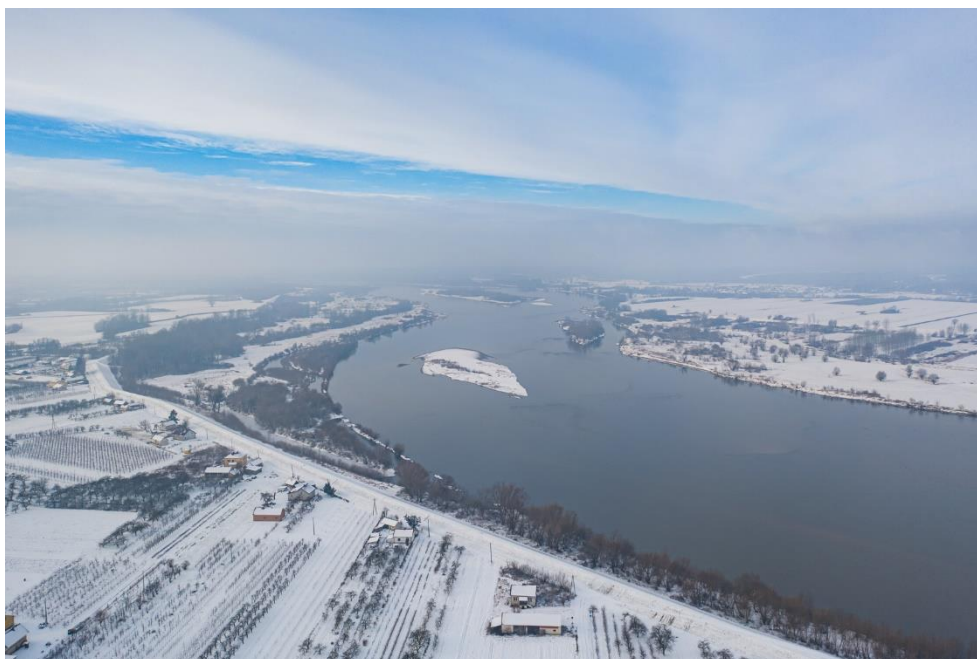
Kazimierz Dolny, 14.01.2021 r.

Poniedziałek zapowiada się dość pogodnie , zwłaszcza we wschodniej połowie kraju. Na zachodzie nasuwająca się stopniowo strefa frontu okluzji spowoduje wzrost zachmurzenia, a po południu miejscami pojawią się opady śniegu , pod koniec dnia na krańcach zachodnich przechodzące w deszcz ze śniegiem. Słabe opady śniegu możliwe są również okresami na wschodzie. Silny mróz notowany w nocy w dzień nieco zelżeje, zwłaszcza na zachodzie. Temperatura maksymalna wynosić będzie od -14°C na północnym wschodzie, -10°C w centrum, do 0°C na krańcach zachodnich. Wiatr będzie słaby, na wschodzie, zachodni, w zachodniej połowie kraju, z kierunków południowych.