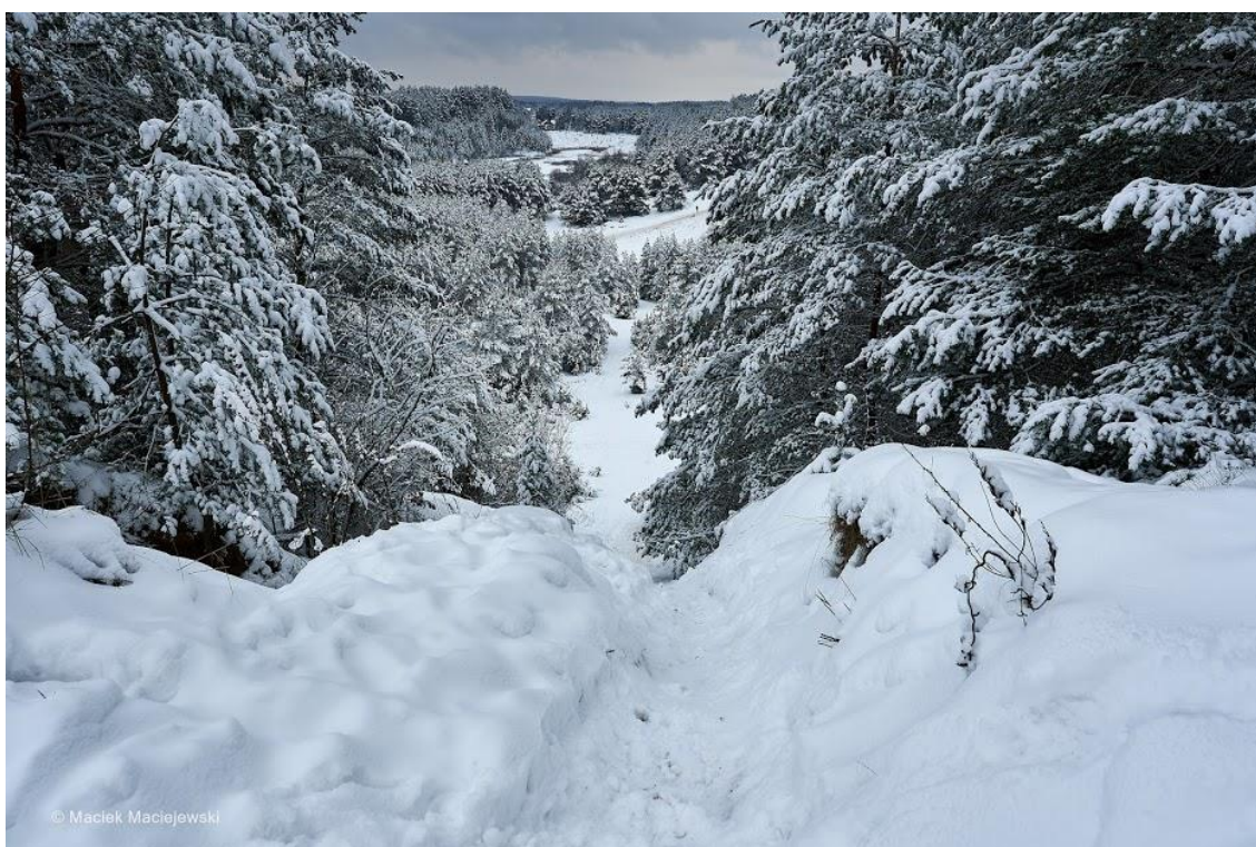
Po opadach śniegu w Puszczy Knyszyńskiej.

We czwartek nieco mniej chmur na południu kraju i tam bez opadów. Z kolei na północy opady śniegu, deszczu ze śniegiem i deszczu.