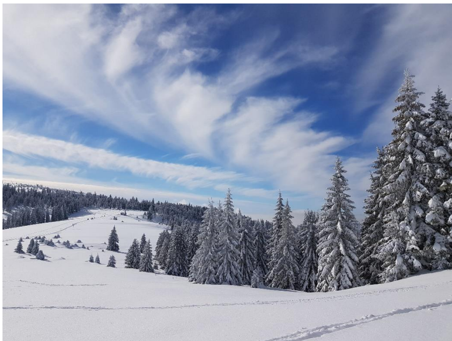
Gorce. Ze szlaku na Turbacz