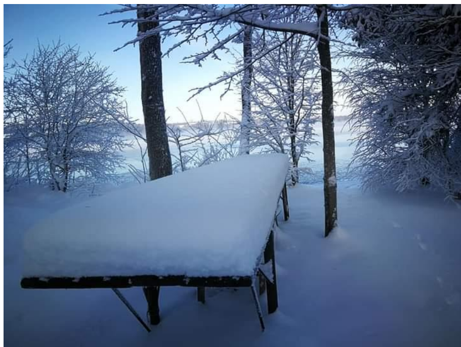
Jezioro Hańcza.

Przejęciowo niewykluczone opady marznące. Na drogach będzie ślisko! Najzimniej na Suwalszczyźnie do -6^{\circ}\text{C} , na pozostałym obszarze kraju od 0^{\circ}\text{C} do nawet 5^{\circ}\text{C} . Wystąpią opady deszczu, na Mazowszu do 15 mm. W centralnej części kraju opady deszczu zaczną przechodzić w deszcz ze śniegiem i śnieg. Opadom będzie towarzyszył silny wiatr , który w porywach może dochodzić nawet do 80 km/h, a wysoko w górach do 130 km/h .