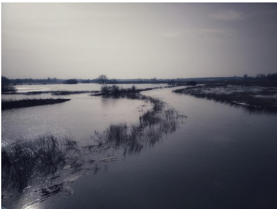
Przekroczony stan alarmowy w profilu Gozdów na rzece Huczwa. Wizyta terenowa SHM Lublin-Radawiec, 04.03.2021 r.