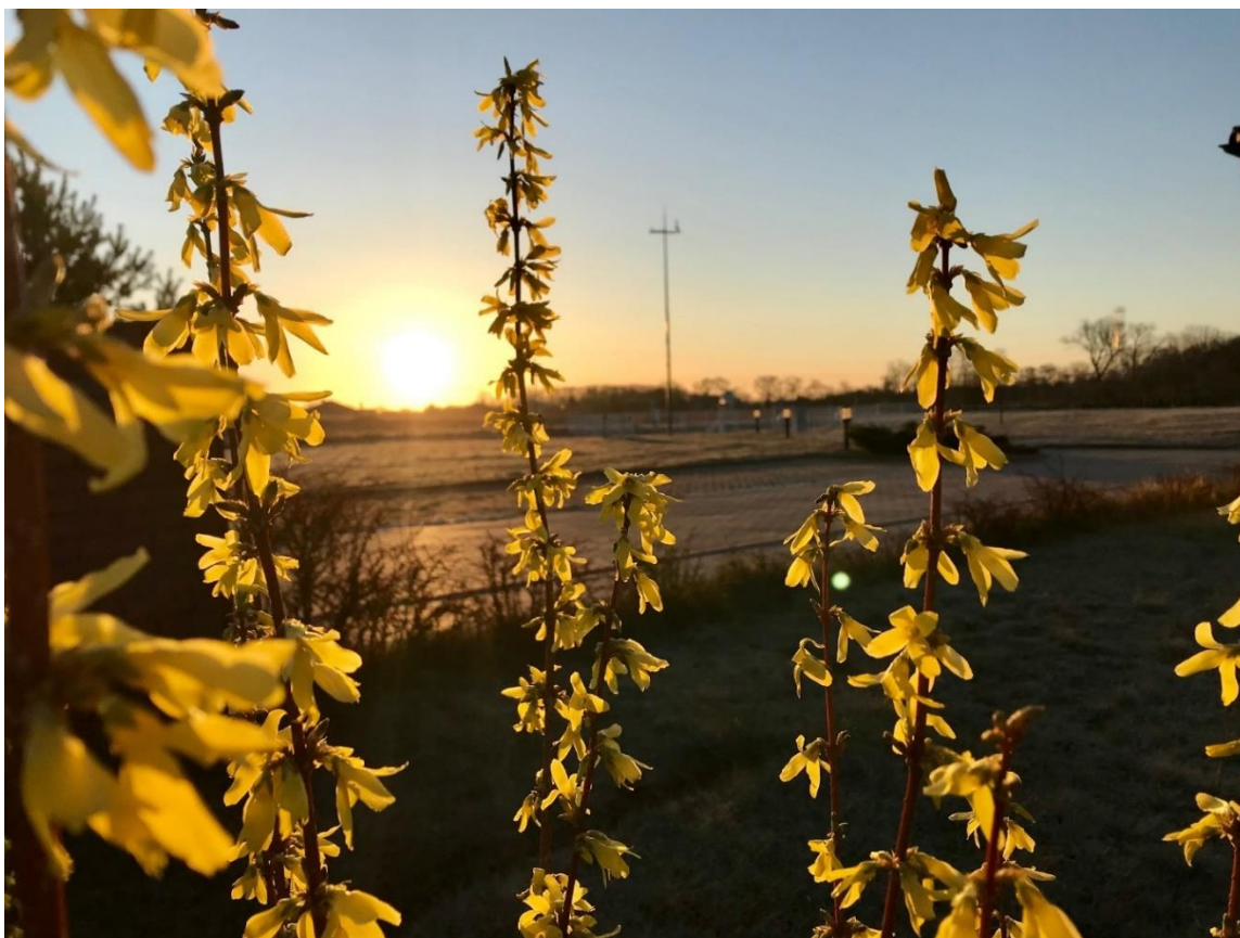
Poranek na stacji meteorologicznej Słubice, 04.04.2021

Koniec tygodnia przyniesie poprawę pogody. Polska znajdzie się w zasięgu wyżu nad Europy południowej. Z zachodu zaczną napływać cieplejsze powietrze polarne morskie. Będzie więcej słońca i tylko miejscami popada przelotny deszcz; osłabnie także wiatr. Temperatura powietrza nocą będzie kilka stopni powyżej 0°C. W dzień temperatura osiągnie wartości od 10°C do 18°C.