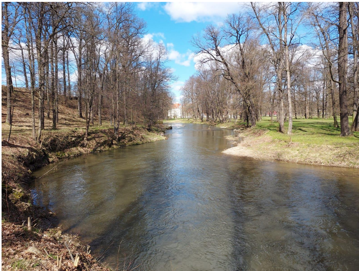
Rzeka Łomnica, 05.04.2021

Początek tygodnia przyniesie zmianę pogody . Wzrośnie zachmurzenie, pojawią się opady deszczu przechodzące w deszcz ze śniegiem i sam śnieg oraz wzrośnie prędkość i porywistość wiatru. Z północy napłynie zimne powietrze pochodzenia arktycznego i pozostanie z nami aż do czwartku . W tym okresie maksymalna temperatura powietrza nie przekroczy 10°C. Pod koniec tygodnia zacznie się ocieplać , będzie więcej słońca, a temperatura powietrza w niedzielę wzrośnie do 18°C.