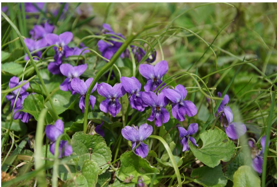
Wiosna w Beskidzie Niskim, 12.04.2021 r.