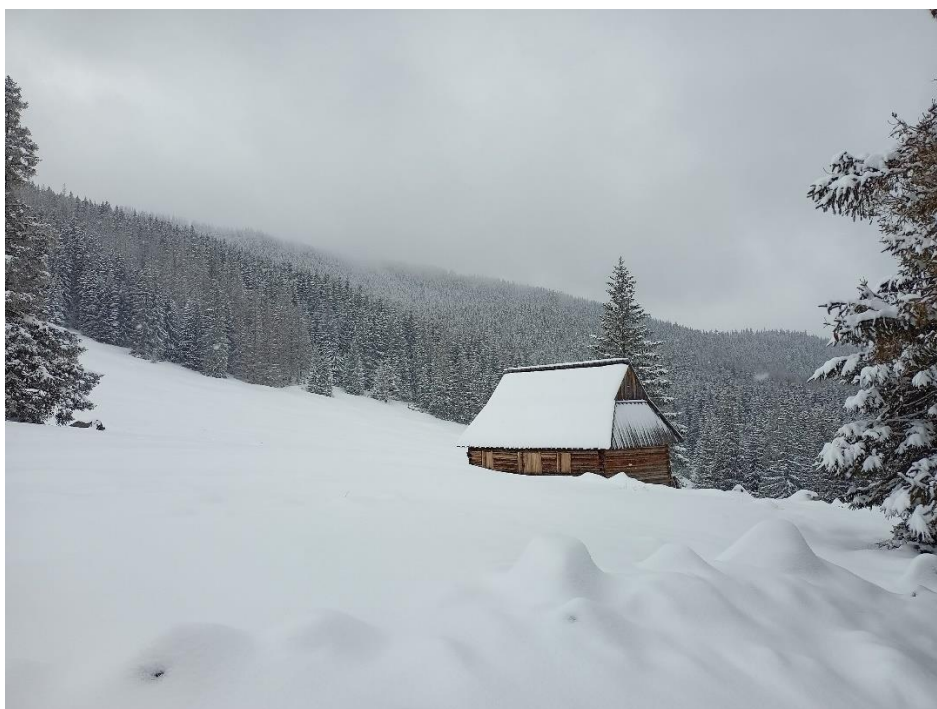
Kwiecień 2021 r. na Podhalu i w Tatrach.

W czwartek Polska znajdzie się w zasięgu niżu znad Bałtyku i z północnego zachodu zacznie stopniowo napływać chłodniejsze powietrze. Miejscami w całym kraju będzie przeloty deszcz, w Tatrach śnieg. Noc na północny i zachód już chłodniejsza, tam lokalnie temperatura spadnie do 1°C, najcieplej na południu, tam 6°C. Również w dzień już trochę chłodniej , 6°C, 8°C na północy i północnym zachodzie do 13°C na południowym wschodzie. Nieco wzrośnie prędkość wiatru, miejscami może być porywisty .