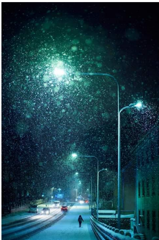
Ostróda, 06.01.2021 r.

Warunki atmosferyczne oraz prognozy mogą się zmienić. Synoptycy IMGW-PIB dokonują codziennych aktualizacji prognoz pogody. Zachęcamy do śledzenia komunikatów i ostrzeżeń na bieżąco na: https://meteo.imgw.pl/ .