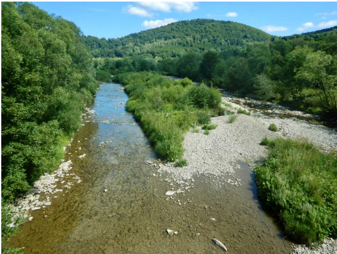
Fot. 3. Wołosaty w Stuposianach, sierpień 2022

Kraków 22°C Kielce 22°C Rzeszów 29°C Zakopane 22°C