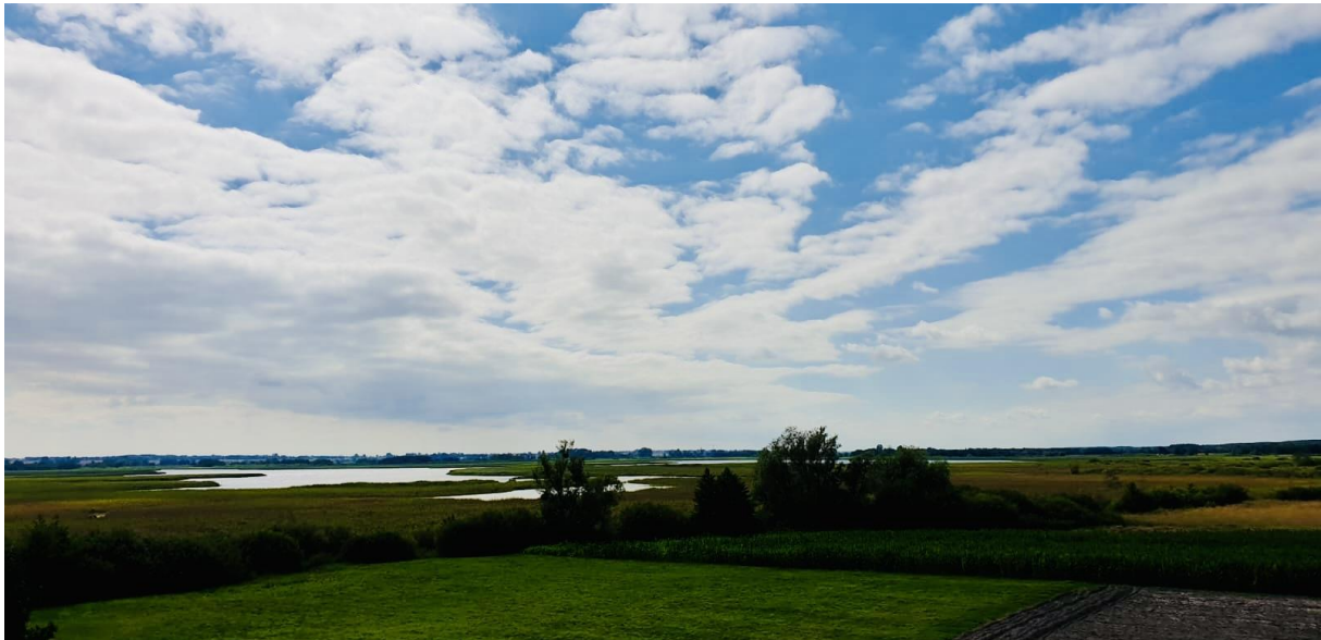
Fot. 1. Jezioro Rakutowskie w Gostynińsko-Włocławskim Parku Krajobrazowym, lipiec 2022, Grzegorz Walijewski

Weekend rozpocznie się od zmiany pogody, z zachodu na wschód przemieści się chłodny front atmosferyczny który przyniesie, w piątek oraz w sobotę, przelotne opady deszczu i burze. Ochłodzi się, upał najdłużej utrzyma się na południowym wschodzie. Niedziela w całym kraju już chłodniejsza, ale pogodna, a przelotny deszcz może padać tylko na północy