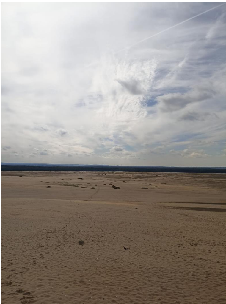
Pustynia Błędowska, wrzesień 2022 r.