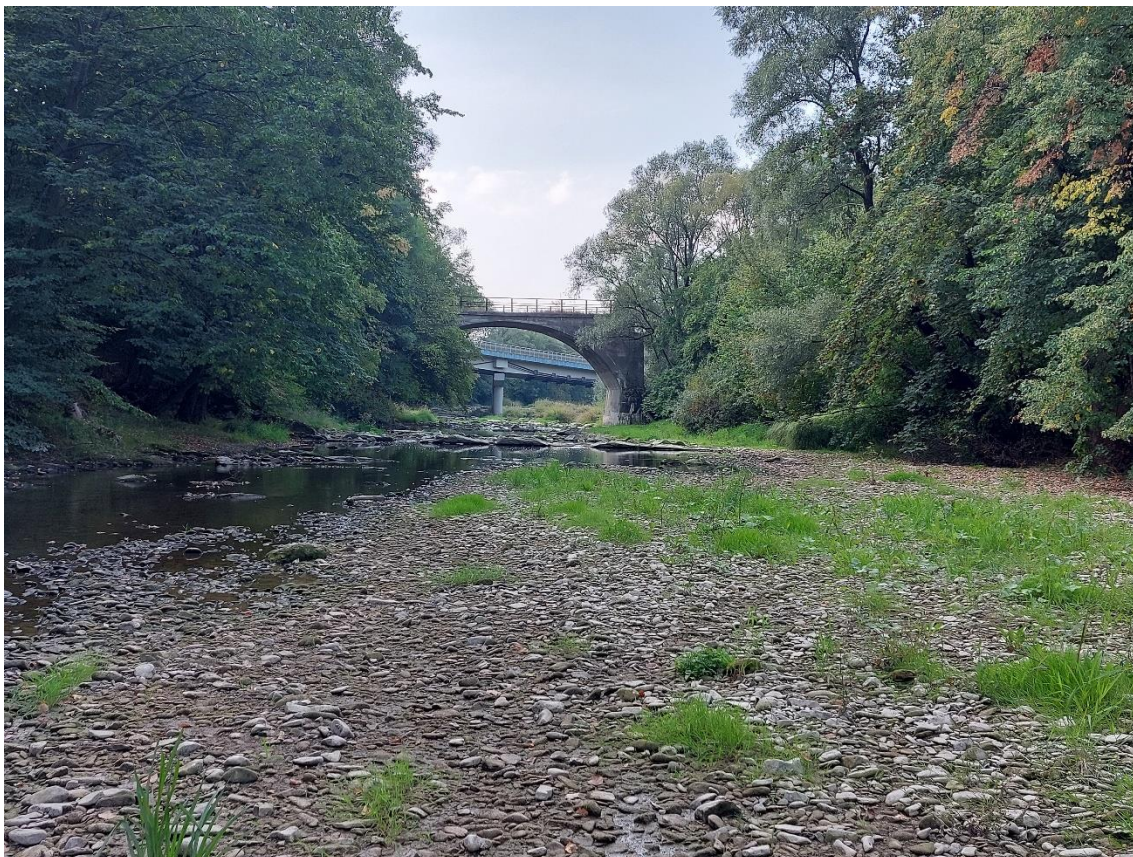
Rzeka Jasiołka w profilu wodowskazowym Zboiska (woj. podkarpackie), wrzesień 2022 r.