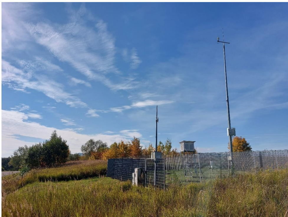
Stacja meteorologiczna w Dukli (woj. podkarpackie), 06.10.2022 r.

Polska będzie pod wpływem wyżu, którego centrum znad południowej Polski przemieści się nad Ukrainę. Z południowego zachodu będzie napływała ciepła, polarna morską masa powietrza. Ciśnienie początkowo będzie rość, w piątek po południu zacznie spadać.