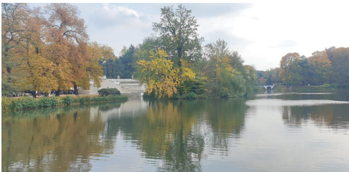
Pałac w Warszawie, 08.10.2022

We wtorek przemieszczać się będzie, z zachodu na wschód kraju, zatoka niżowa z chłodnym frontem atmosferycznym, a za nią w środe ponownie rozbuduje się klin wyżu znad Atlantyku. Miejscami, szczególnie na północy kraju, pojawią się przelotne opady deszczu oraz będzie nieco chłodniej. Temperatura powietrza w nocy wyniesie od 2°C do 9°C, a w dzień od 12°C do 16°C. Wiatr zmieni swój kierunek na zachodni oraz północny i we wtorek będzie porywisty.