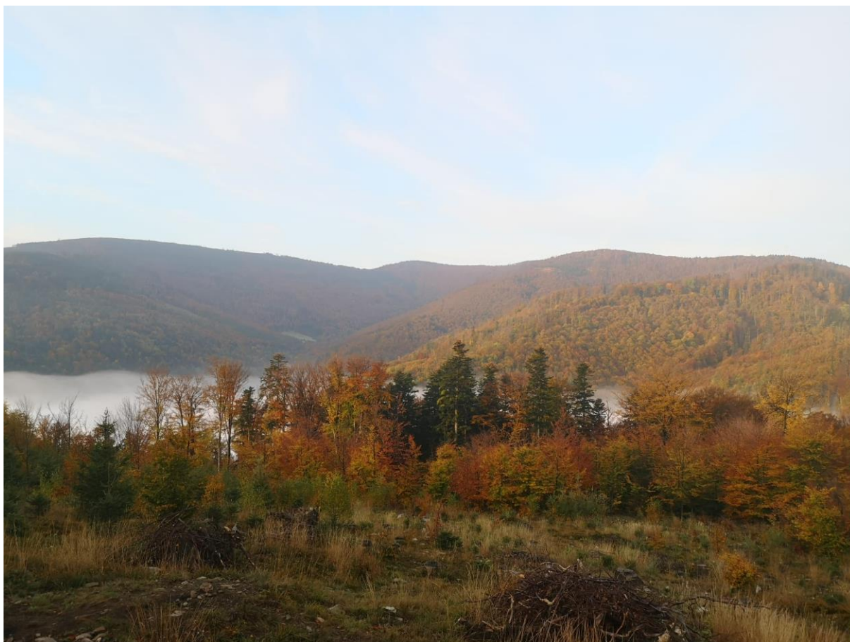
Beskid Niski, 13.10.2020 r.

Toruń 16°C Kalisz 16°C Bydgoszcz 16°C Zielona Góra 16°C