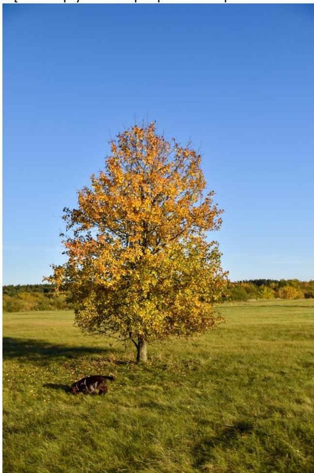
Mazowsze w październiku, 10.10.2020 r.

Polska będzie w zasięgu zatoki niżu znad Morza Norweskiego. Z zachodu na wschód będzie przemieszczał się układ frontów atmosferycznych. Z południowego zachodu i południa nadal będzie napływało ciepłe powietrze polarne morskie. Spadek ciśnienia.