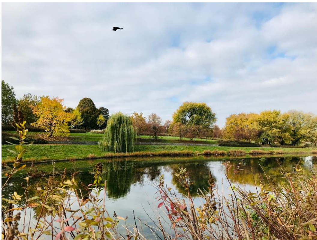
Październik 2022 r. w warszawskim parku.

Polska będzie na skraju wspomnianego wyżu, ale na zachodzie kraju zaznaczy się zatoka niżowa z pofalowanym frontem chłodnym. Na wschodzie kraju pozostanie chłodne powietrze pochodzenia arktycznego, natomiast na zachód zacznie napływać ciepłe powietrze polarne morskie. Ciśnienie będzie spadać.