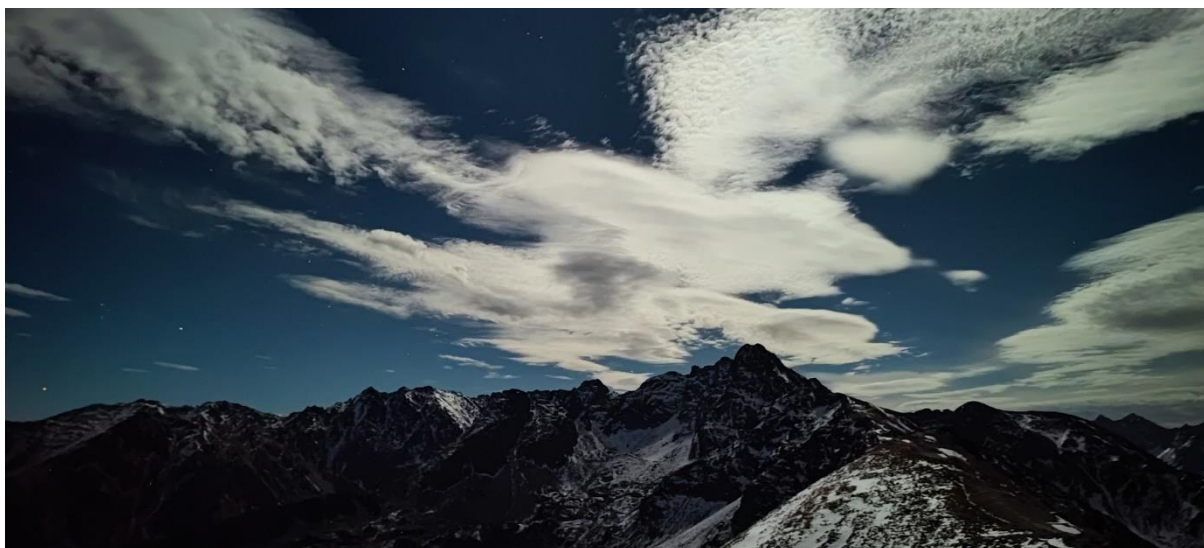
Widoki z Kasprowego Wierchu, 11.10.2022 r.

Kraków 17°C Kielce 16°C Rzeszów 17°C Zakopane 14°C