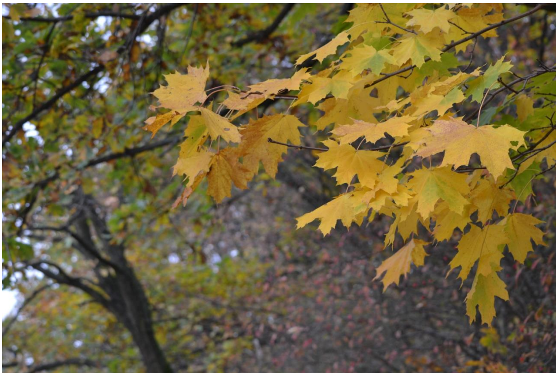
Jesień, październik 2022 r.