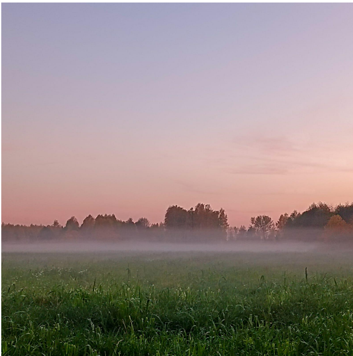
Jesienne mgły na Mazowszu, 27.10.2022 r.