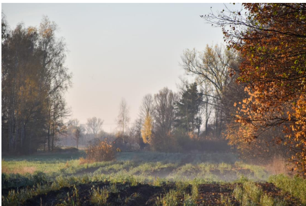
Chłodny poranek na Mazowszu, 03.11.2022 r.

Polska jest w zasięgu rozległego układu niżowego rozciągającego się od Morza Norweskiego przez Europę Środkową po basen Morza Śródziemnego. Po południu nad zachodnie pogranicze nasunie się chłodny front atmosferyczny. Z południa napłynie ciepłe powietrze polarne morskie. Ciśnienie będzie spadać.