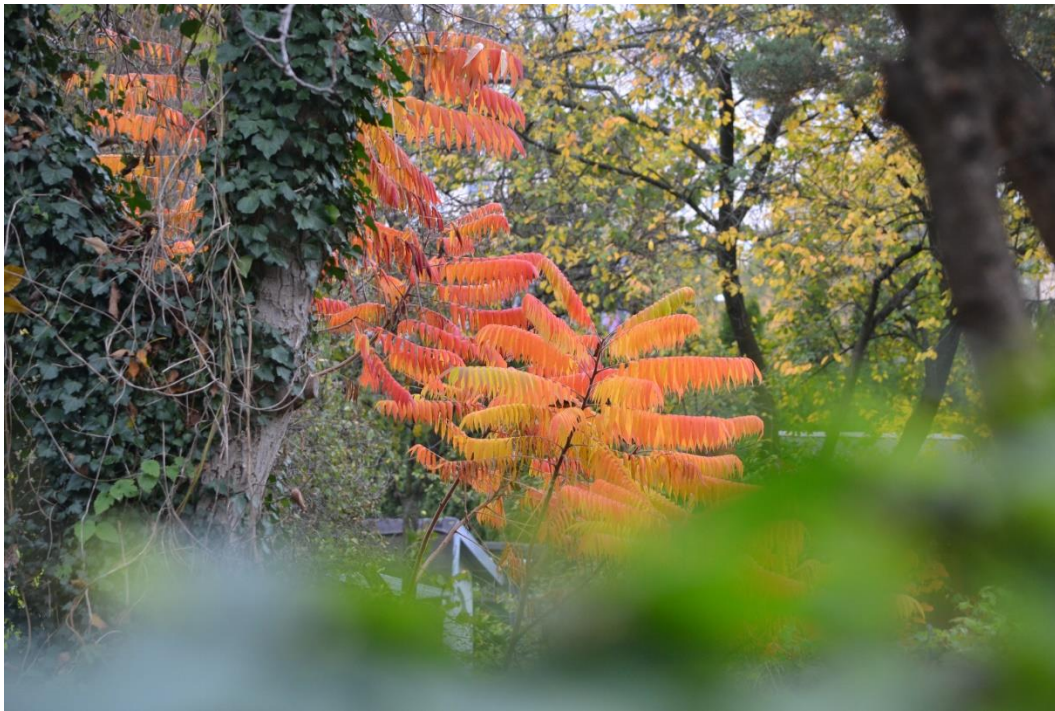
Jesień 2022 r.