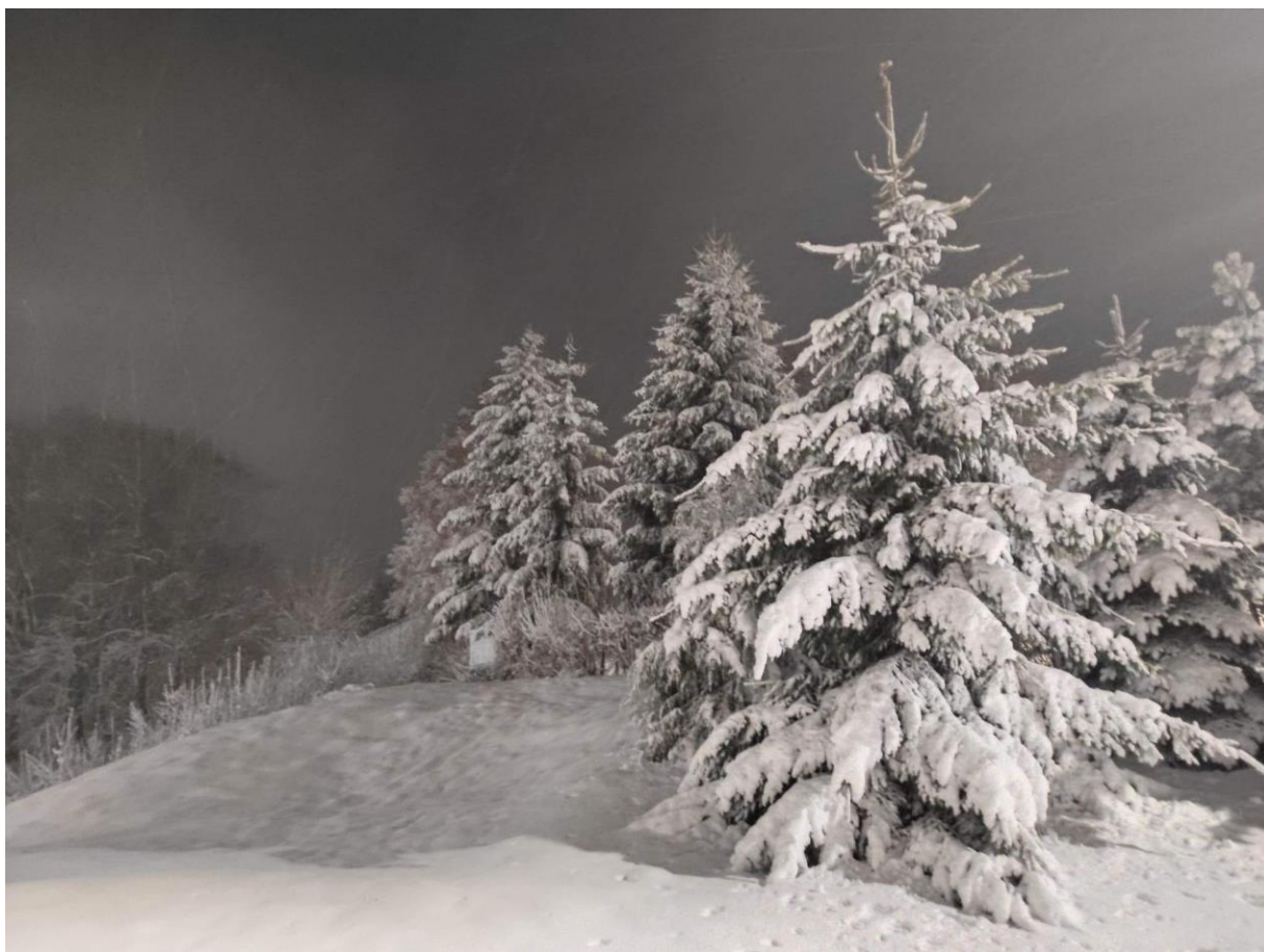
Milejewo (woj. warmińsko-mazurskie), 12.12.2022 r.