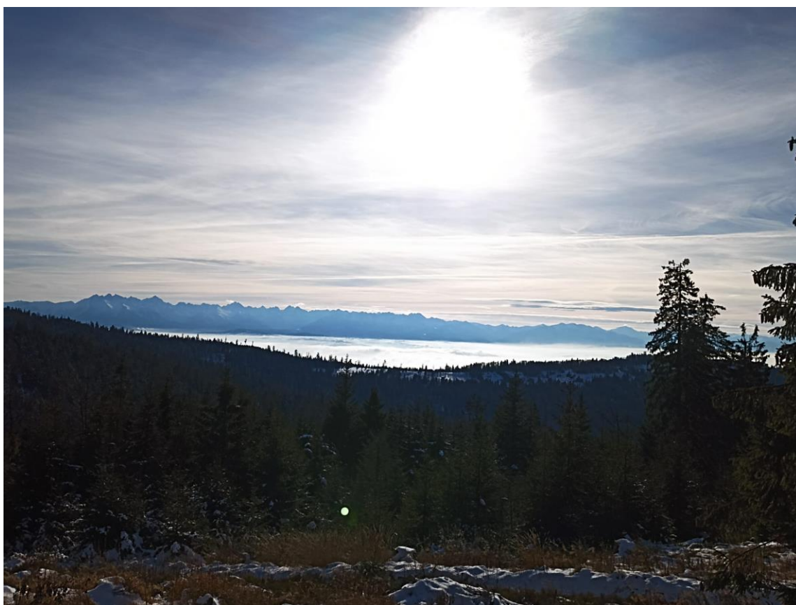
Grudniowa panorama Tatr.