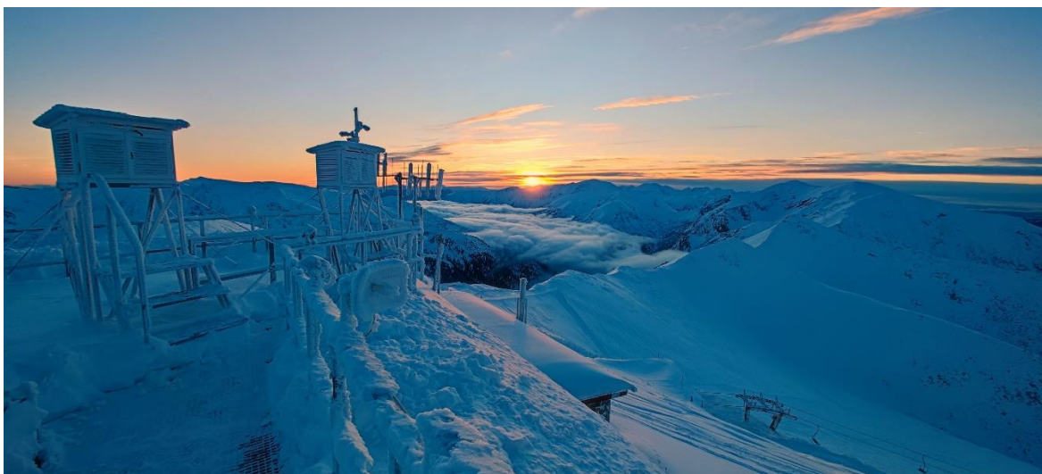
Zima na Kasprowym Wierchu, 12.01.2023 r.