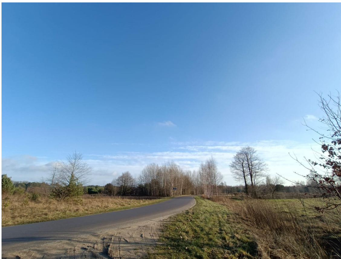
Styczeń na Mazowszu, 12.01.2023 r.