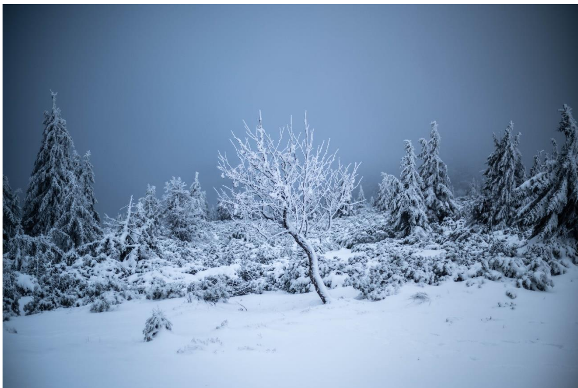
Zima w Karkonoszach, 14.01.2023 r.

W poniedziałek opady deszczu na wschodnich krańcach kraju, a w Bieszczadach śniegu. Na pozostałym obszarze kraju będzie bez opadów i sporo słońca. Temperatura maksymalna od 3°C do 5°C. Wiatr przeważnie umiarkowany, okresami porywisty, południowo-wschodni i południowy.