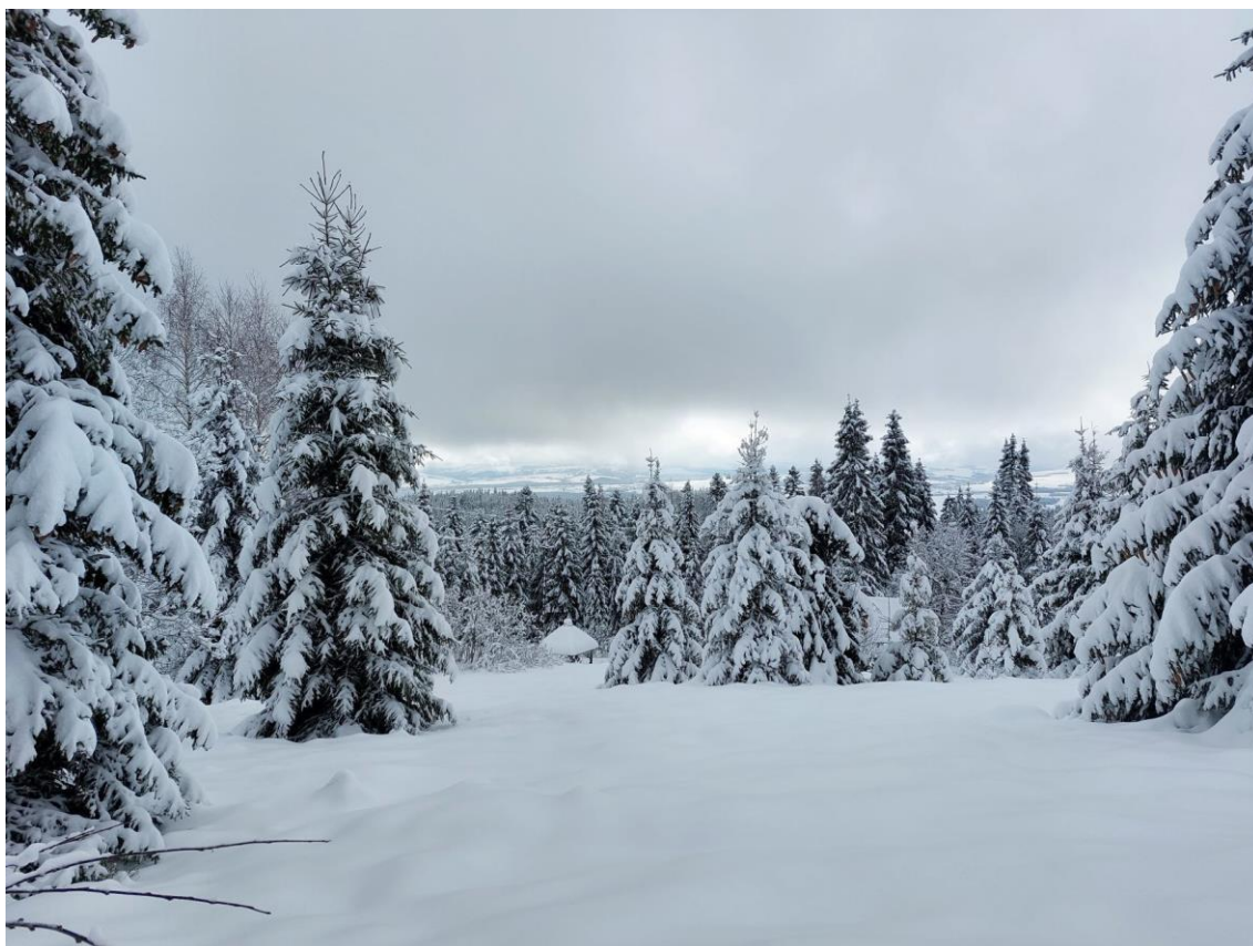
Na szlaku na Turbacz, 21.01.2023 r.