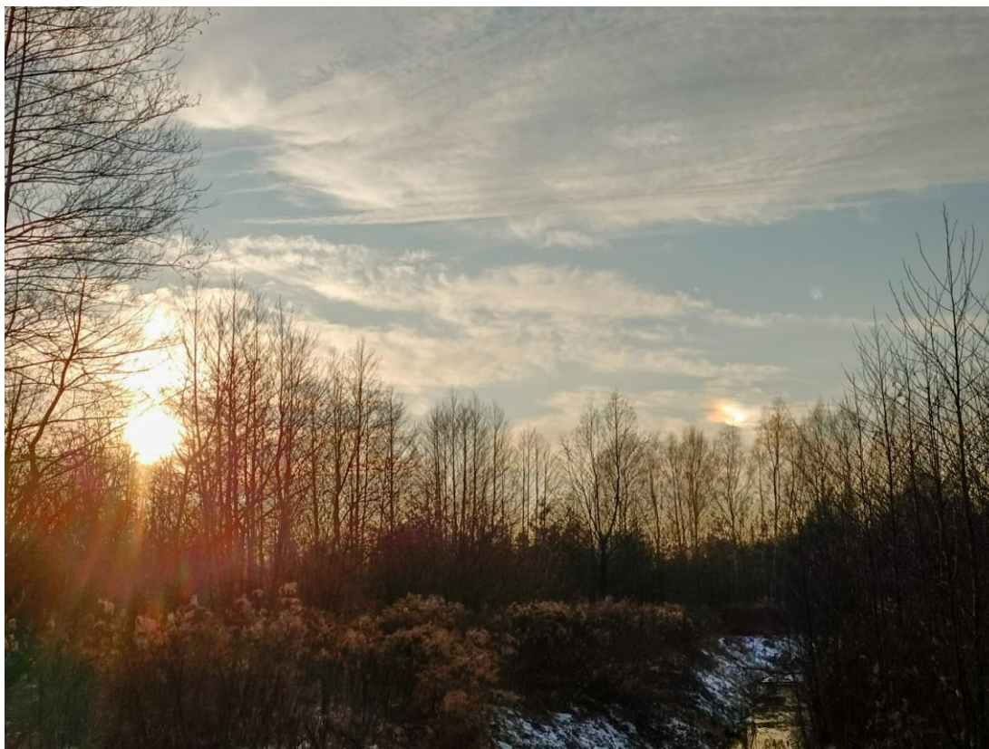
Zachód słońca oraz słońce poboczne obserwowane na Mazowszu, 09.02.2023 r.

Pogodę pod koniec tygodnia będzie kształtował aktywny niż z frontami atmosferycznymi, przemieszczający się z zachodu na wschód i południowy wschód kraju. Przyniesie on porywisty wiatr, duże zachmurzenie i opady śniegu, deszczu ze śniegiem i deszczu. Lokalnie także opady marznące. W nocy nadal będzie mroźno, zwłaszcza na południu Polski.