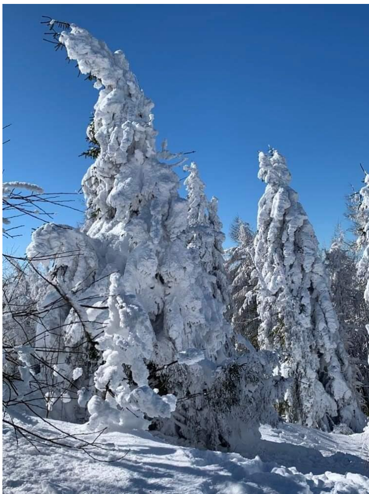
Zima w Jaworzynie Krynickiej, 09.02.2023 r.