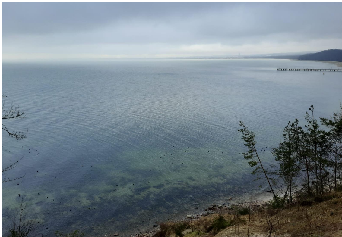
Widoki na Bałtyk z Klifu Orłowskiego w Gdyni, 25.02.2023 r.

Kraków: 2°C Kielce: 1°C Rzeszów: 1°C Zakopane: -1°C