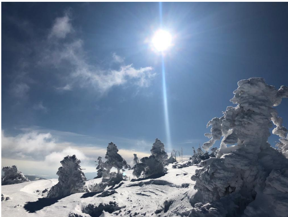
Zimowe widoki w Karkonoszach.