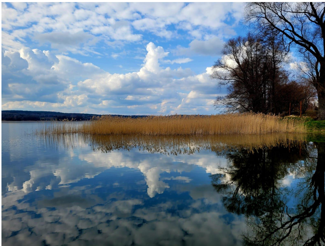
Jez. Rydzówka (Mazury, gmina Węgorzewo), 09.04.2023 r.