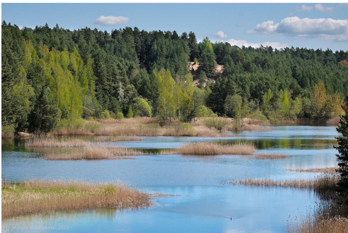
W puszczy Knyszyńskiej, Fot. Maciej Maciejewski IMGW-PIB

Po bardzo ciepłym i wiosennym weekendzie przyszły tydzień pod znakiem zmiennej pogody. Poniedziałek i wtorek jeszcze w całym kraju z wysokimi temperaturami, od środy ochłodzenie i przelotne opady deszczu. Pod koniec tygodnia wróci słoneczna, ale chłodniejsza aura.