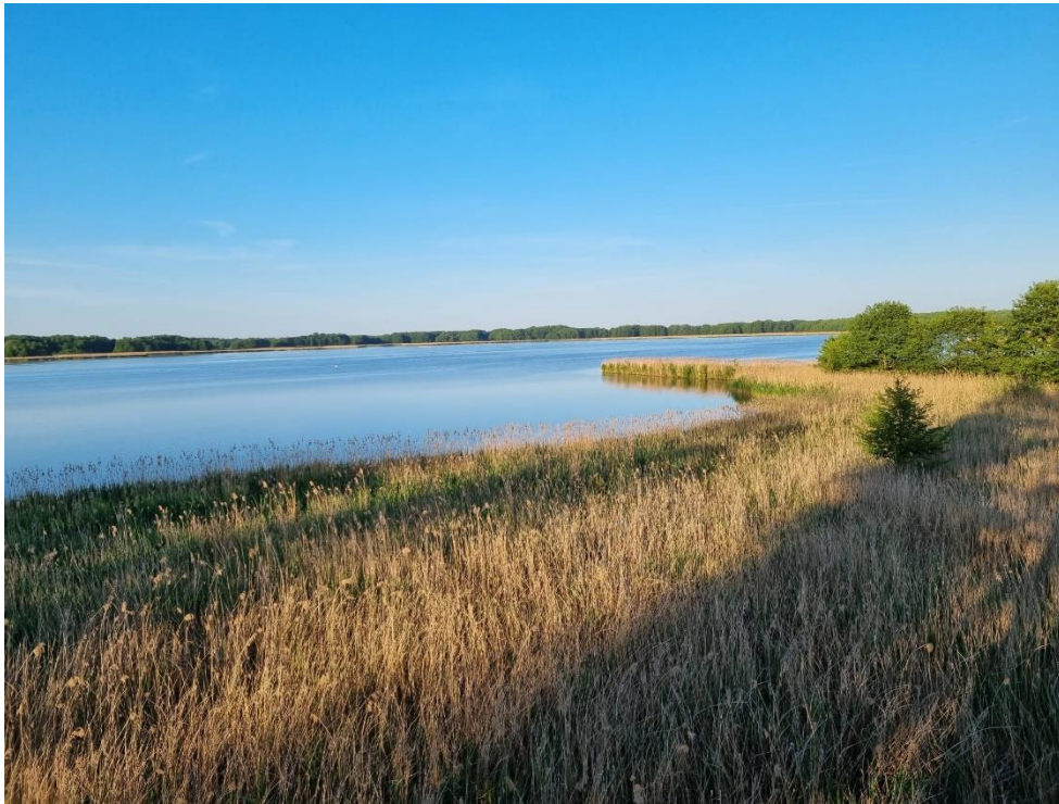
Barycz, 31.05.2023 r.

Weekend na przeważającym obszarze kraju będzie pogodny i umiarkowanie ciepły. Pozostaniemy w zasięgu rozległego i silnego wyżu znad Atlantyku, który ograniczy rozwój chmur, ale jednocześnie sprowadzi do Polski chłodne masy powietrza. W piątek i niedzielę opady deszczu występować będą głównie na południowym wschodzie kraju. W piątek w Karpatach mogą pojawić się burze.