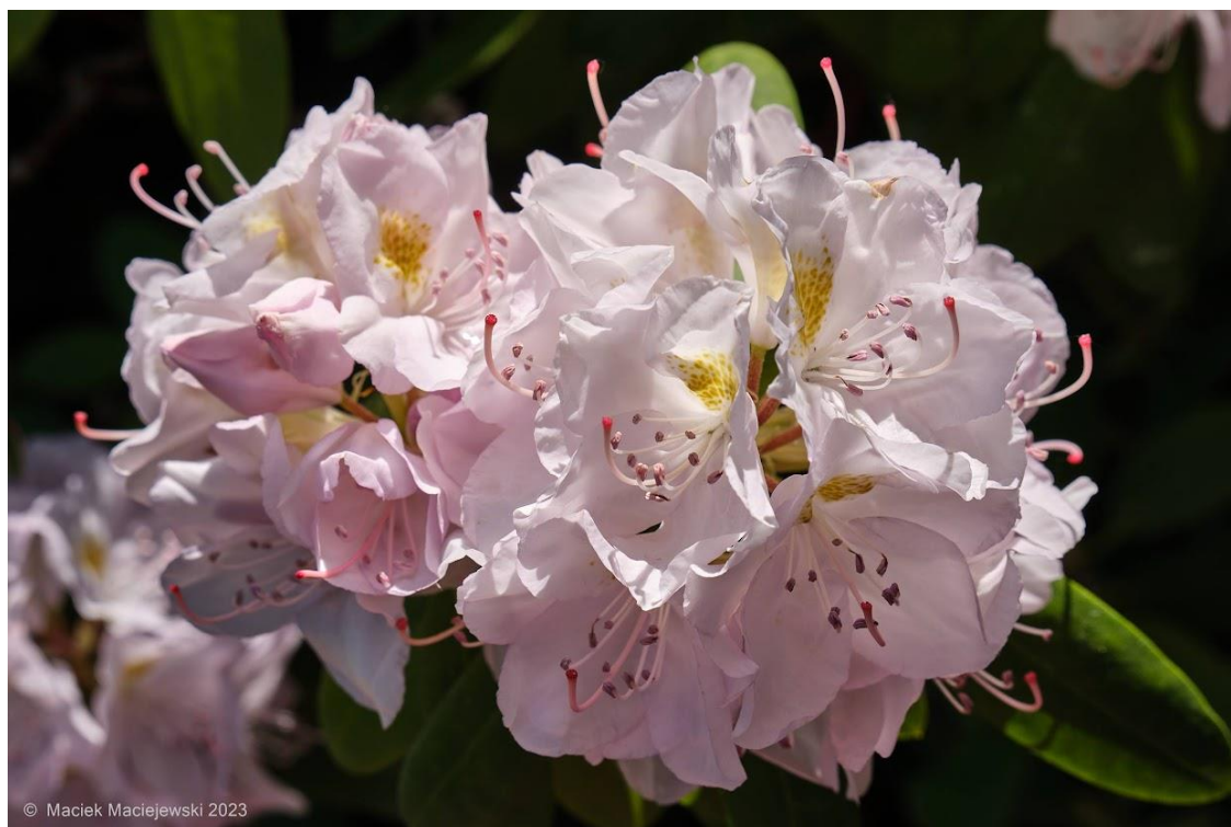
© Maciek Maciejewski 2023 Różaneczniki. Fot. Maciej Maciejewski | IMGW-PIB