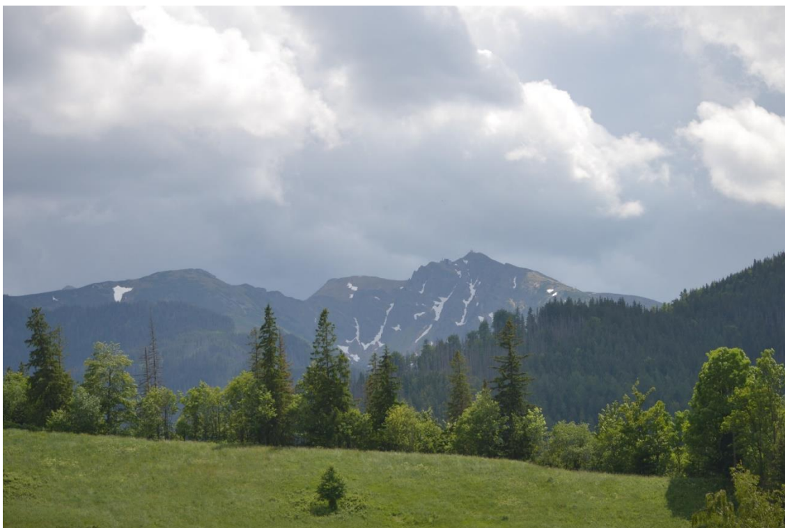
Lato w Tatrach, widok na góry, 18.06.2023 r.