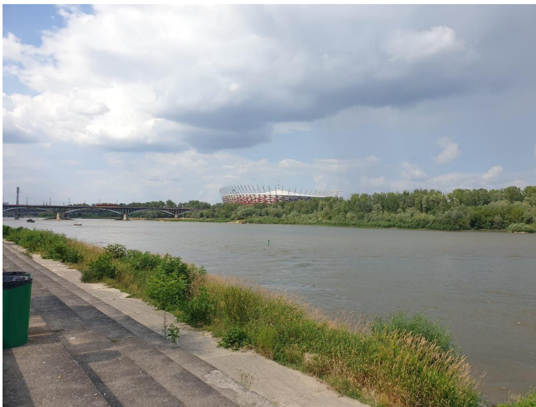
Wisła w Warszawie, 25.06.2023 r.

W poniedziałek na przeważającym obszarze kraju pogodnie i ciepło, jedynie na wschodzie więcej chmur i możliwy przelotny deszcz lub słaba burza. Później wieczorem nad zachodnie krańce Polski dotrze znad Niemiec aktywna zatoka niżowa z intensywnym deszczem i silnymi burzami. Front deszczowo-burzowy opuści Polskę po południu we wtorek. Za frontem znacznie napływać do nas chłodniejsze powietrze polarne morskie. Upały powrócą w weekend.