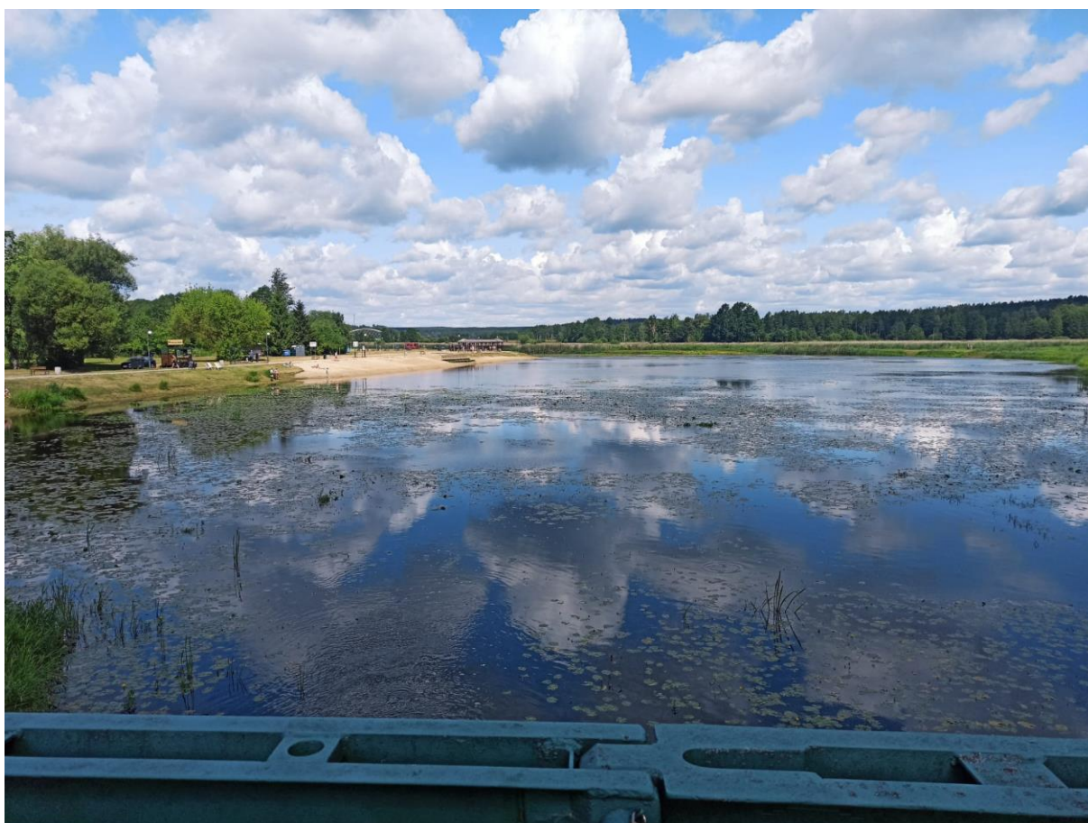
Supraśl, Fot. Paweł Staniszewski | IMGW-PIB

W niedzielę strefa burz przemieści się nad wschodnią Polskę, a przelotny deszcz możliwy jest lokalnie w całym kraju. Zrobi się nieco chłodniej. Temperatura maksymalna wynosić będzie od 22°C nad morzem do 28°C, w centrum i na południu.