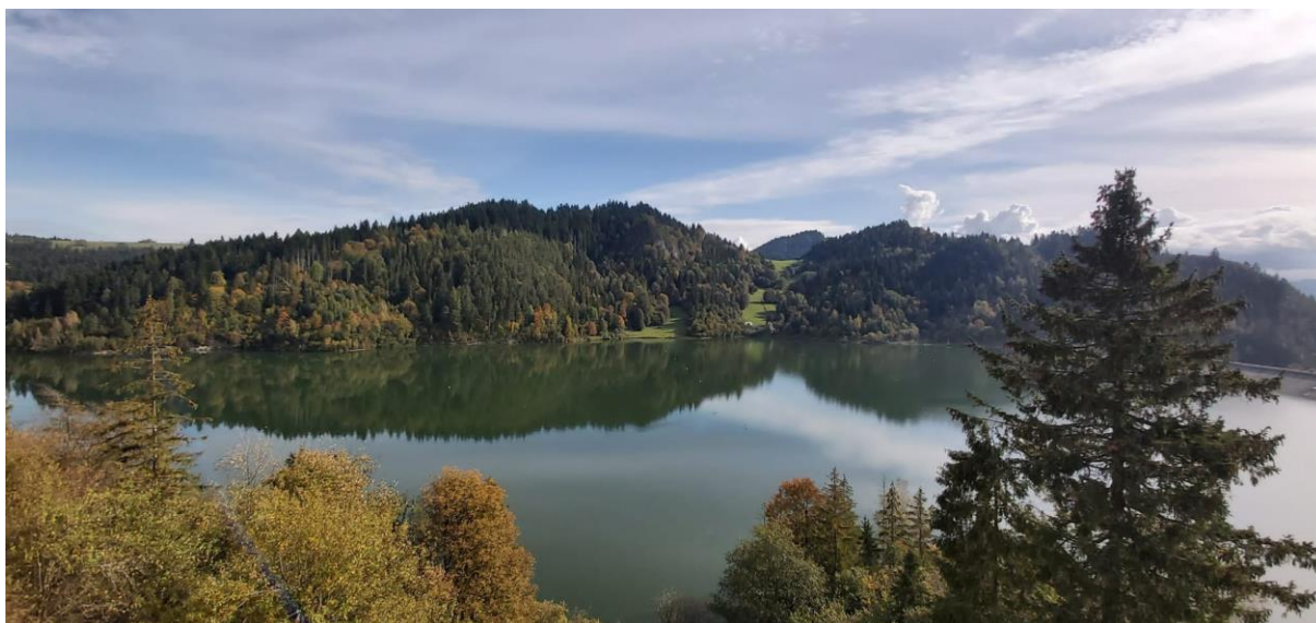
Widok na Jezioro Czorszyńskie.

Kraków: 21°C Kielce: 21°C Rzeszów: 21°C Zakopane: 17°C