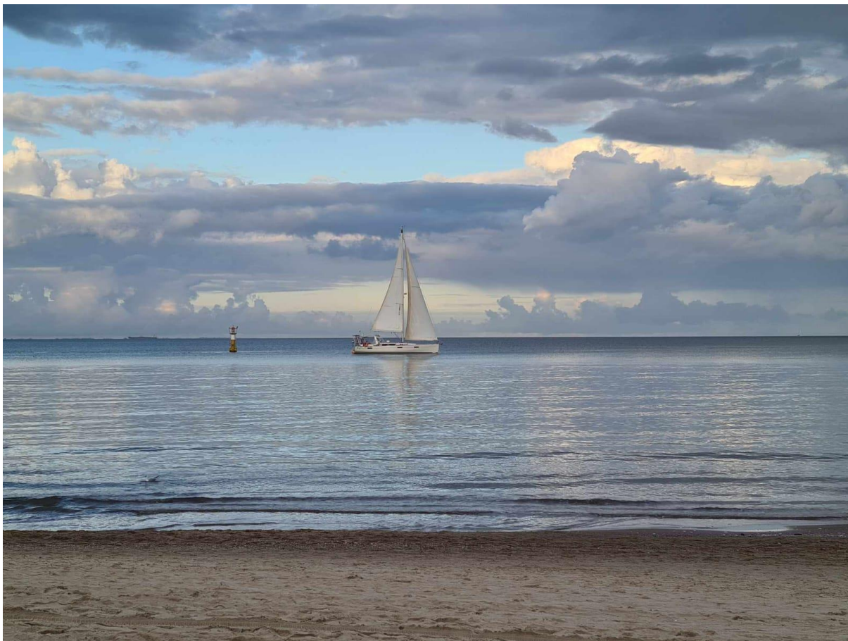
Morze Bałtyckie