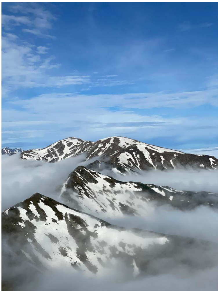
Tatry, 08.05.2024 r.