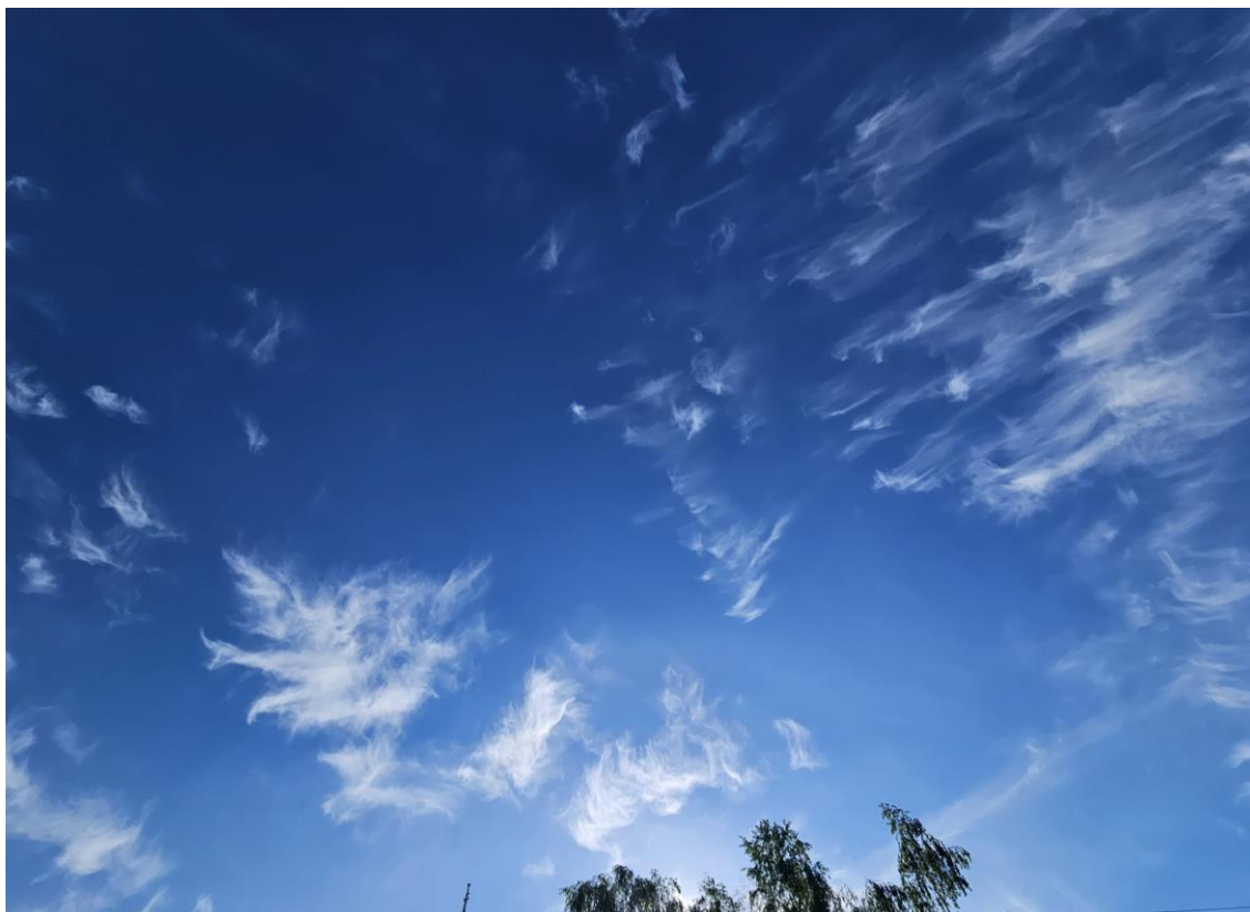
Chmury Cirrus, 06.05.2024 r.