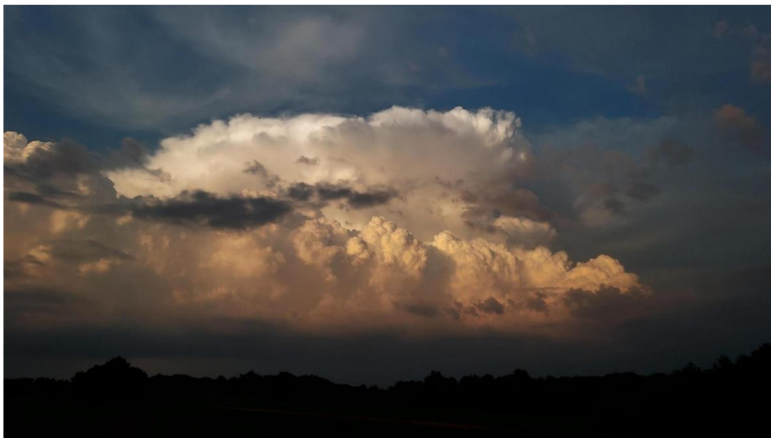
Chmura burzowa Cumulonimbus w okolicy Wadowic (woj. małopolskie), 29.05.2024 r.

W weekend w Polsce będzie burzowo, zwłaszcza w początkowej jego części. W piątek najwięcej opadów na krańcach południowo-zachodnich. W nocy z piątku na sobotę ekstremalne zjawiska, takie jak grad, trąby powietrzne czy porywy wiatru do 120 km/h, możliwe są w południowej połowie kraju. W sobotę strefa najgroźniejszych burz przesunie się na wschód. W niedzielę już zdecydowanie spokojniej, słabe opady możliwe jedynie na północy. W piątek miejscami na południu kraju temperatura może przekroczyć 30°C.