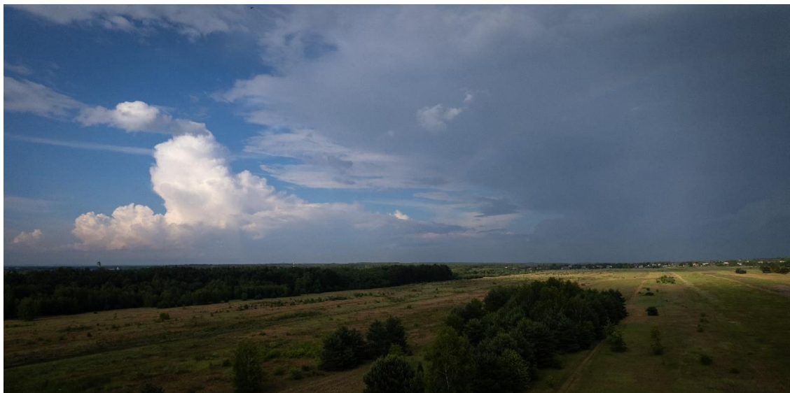
Chmura burzowa Cumulonimbus w okolicy Pyrzowic (woj. śląskie), 02.06.2024 r.

Kraków: 31°C Kielce: 28°C Rzeszów: 28°C Zakopane: 26°C