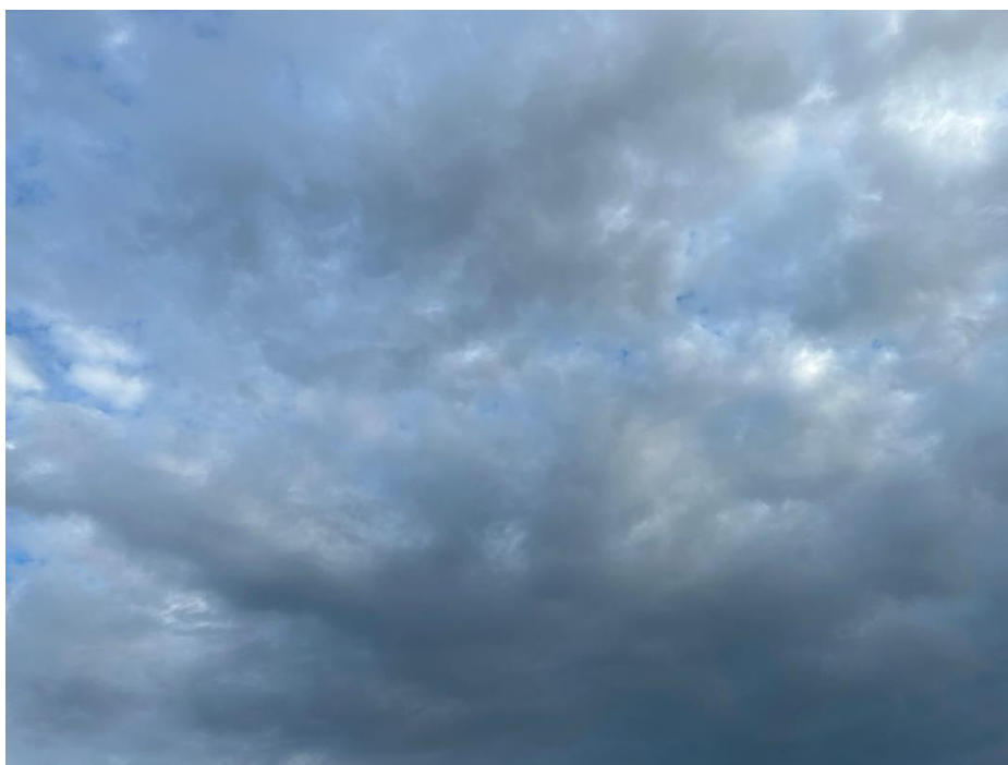
Pochmurne niebo, sierpień 2024

Rozpoczynający się tydzień przyniesie liczne opady deszczu oraz burze, głównie na zachodzie i południu kraju. Aż do środy miejscami opady mogą być intensywne. Jednocześnie powinniśmy nieco odpocząć od upałów, które do środy mogą utrzymać się tylko na południowym wschodzie. Druga połowa tygodnia zapowiada się nieco chłodniej, ale za to będzie więcej słońca. Upał może powrócić już w weekend, a w niedziele możliwe są ponownie burze.