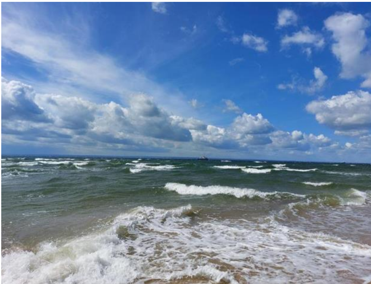
Fot. 1. Morze Bałtyckie – Agnieszka Madejak.