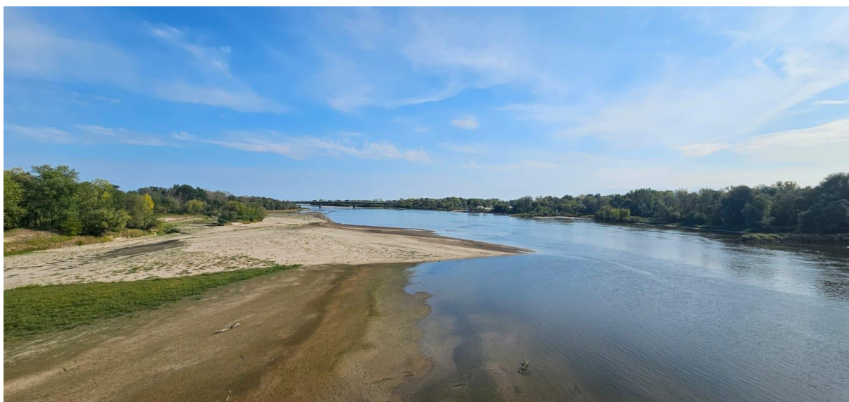
Wiśła w okolicach miasta Góra Kalwaria.

Na przeważającym obszarze kraju tydzień rozpocznie się spokojnie i poza obszarami górskimi, gdzie w poniedziałek i we wtorek może przelotnie popadać i zagrzemieć, będzie na ogół pogodnie i sucho. Przelotne opady deszczu i burze w zachodniej połowie kraju pojawią się od czwartku, w części wschodniej pogodnie i sucho powinno być również w kolejnych dniach. Na początku tygodnia z południa ponownie zacznie napływać gorące powietrze pochodzenia zwrotnikowego i od wtorku do czwartku lub piątku wrócą upały. Ochłodzenie spodziewane jest podczas weekendu.