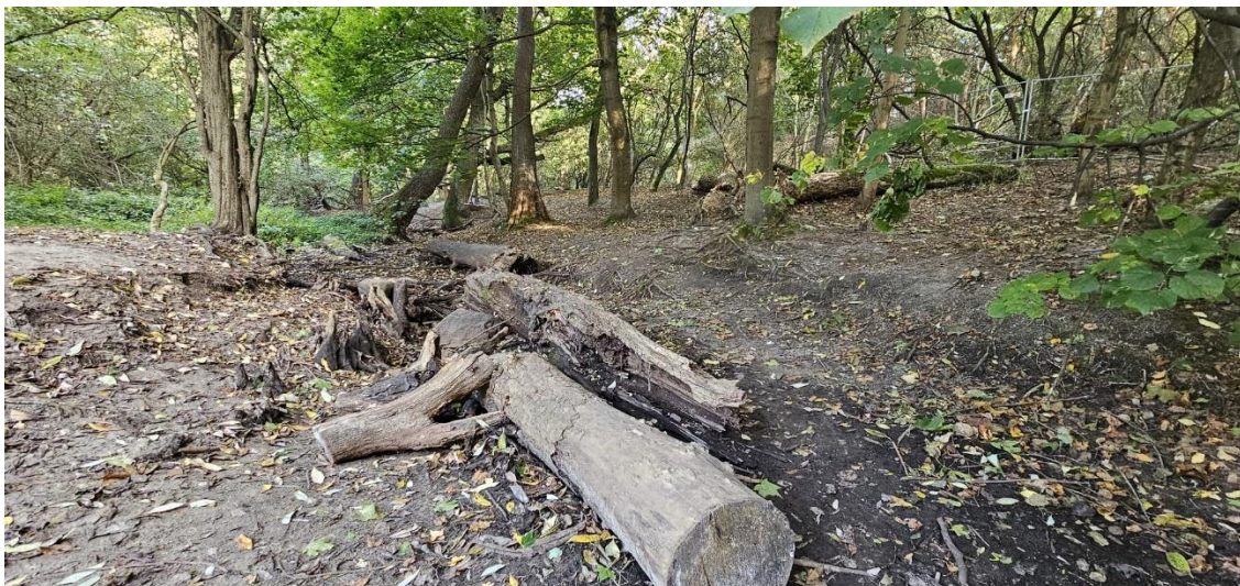
Lipkowska Woda w Puszczy Kampinoskiej, brak wody w korycie, 01.10.2024 r.