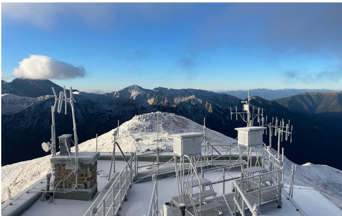
Tatry widziane z ogródka meteorologicznego w Wysokogórskim Obserwatorium Meteorologicznym IMGW-PIB na Kasprowym Wierchu, 30.09.2024 r.