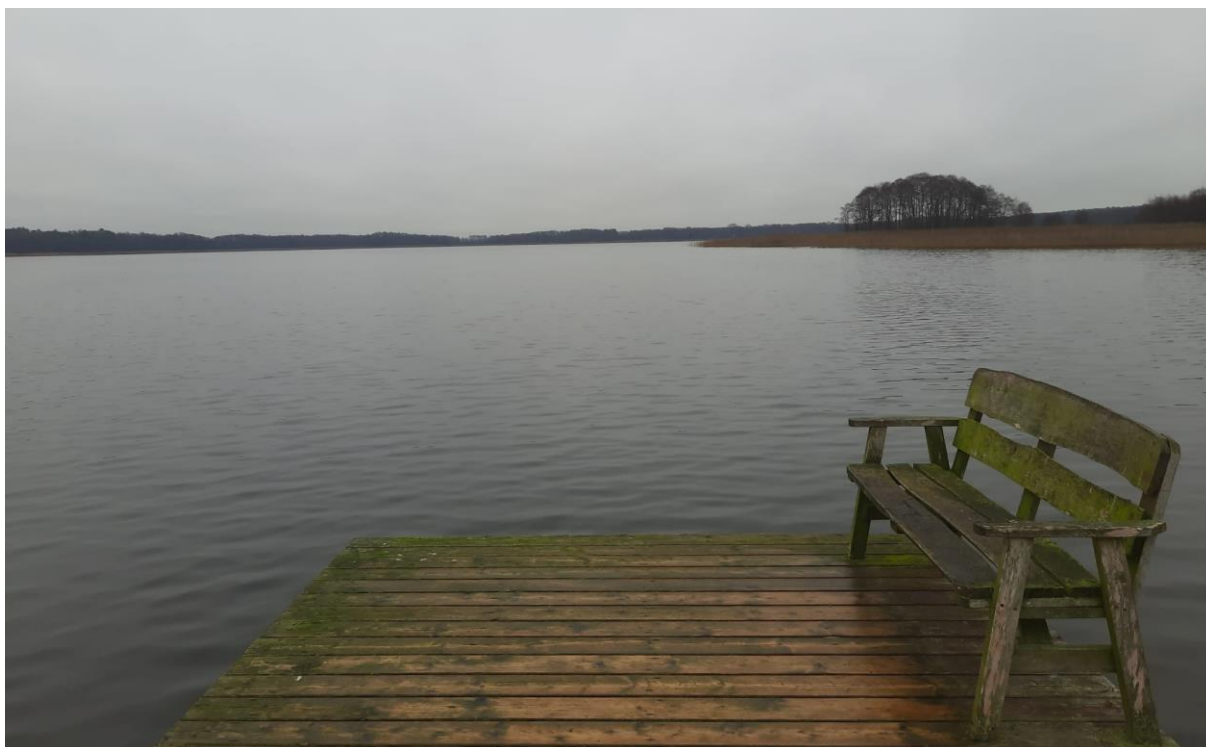
Jezioro Sasek Mały, 08.12.2024 r.

W niedzielę ponownie pochmurno z opadami deszczu, deszczu ze śniegiem i śniegu. Rano mroźno, temperatura od –6°C na południu do 0°C nad morzem. W dzień od 0°C na Suwalszczyźnie do 4°C na Dolnym Śląsku i Opolszczyźnie. Nad morzem porywy wiatru do 60 km/h.