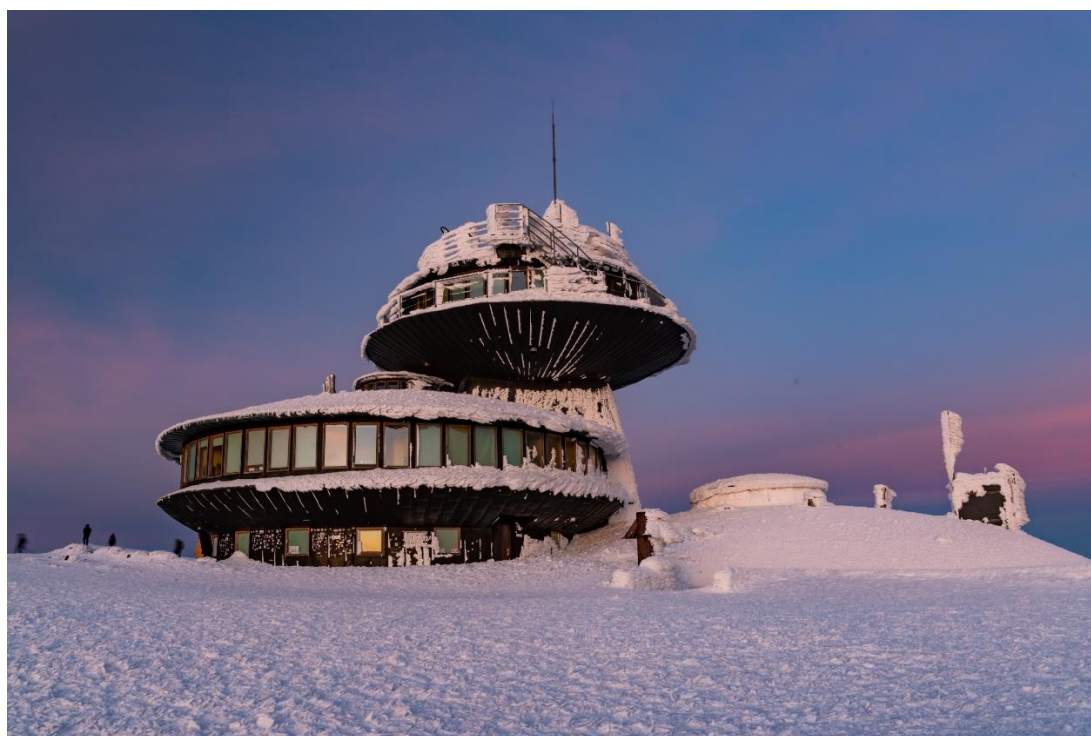
Styczienny poranek na Śnieżce, 30.01.2023 r.

Przed nami kolejny tydzień z przewagą pochmurnej pogody i opadami, głównie śniegu. W dzień na ogół temperatura dodatnia, w nocy kilka stopni poniżej zera. Najwięcej śniegu spadnie w górach i tam z dnia na dzień będzie go przybywać. W dolinach górskich, w trakcie roz pogodzeń, noce mogą być mroźne, do -15^{\circ}\text{C} , zwłaszcza na Podhalu. UWAGA: silny wiatr w poniedziałek, do 85 km/h na północy kraju, stopniowo słabnący w nocy z poniedziałku na wtorek.