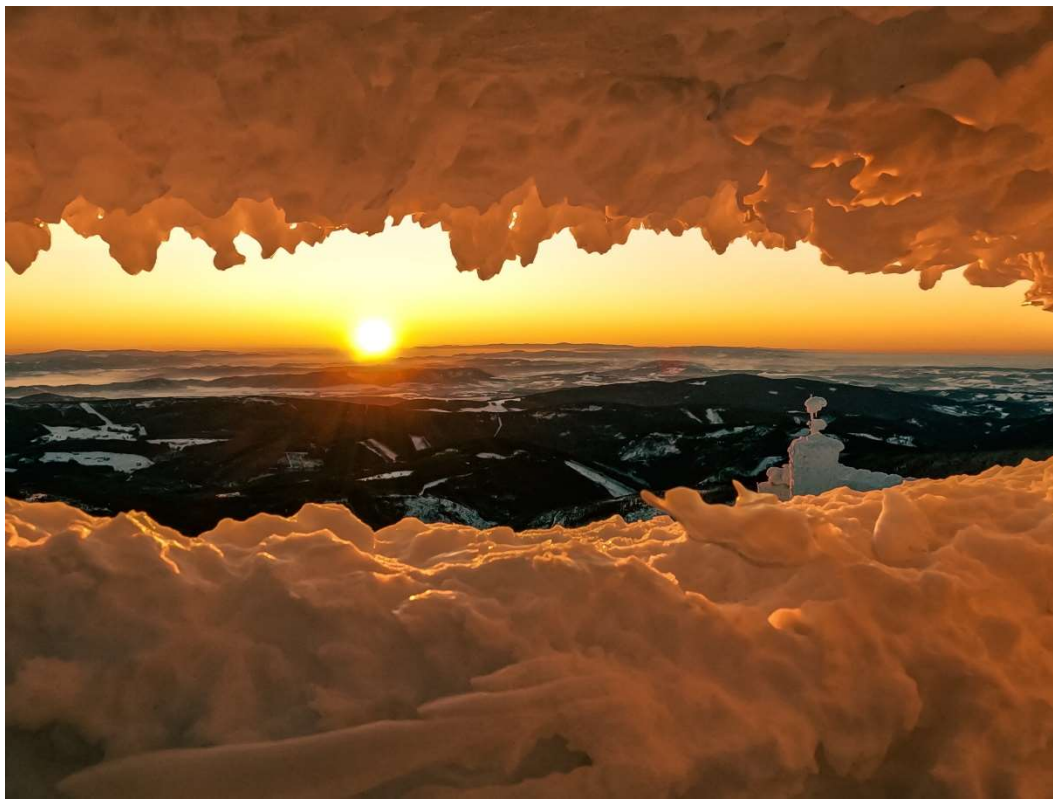
Wschód słońca na Śnieżce, 07.02.2023 r.

Kraków: 8°C Kielce: 7°C Rzeszów: 6°C Zakopane: 4°C