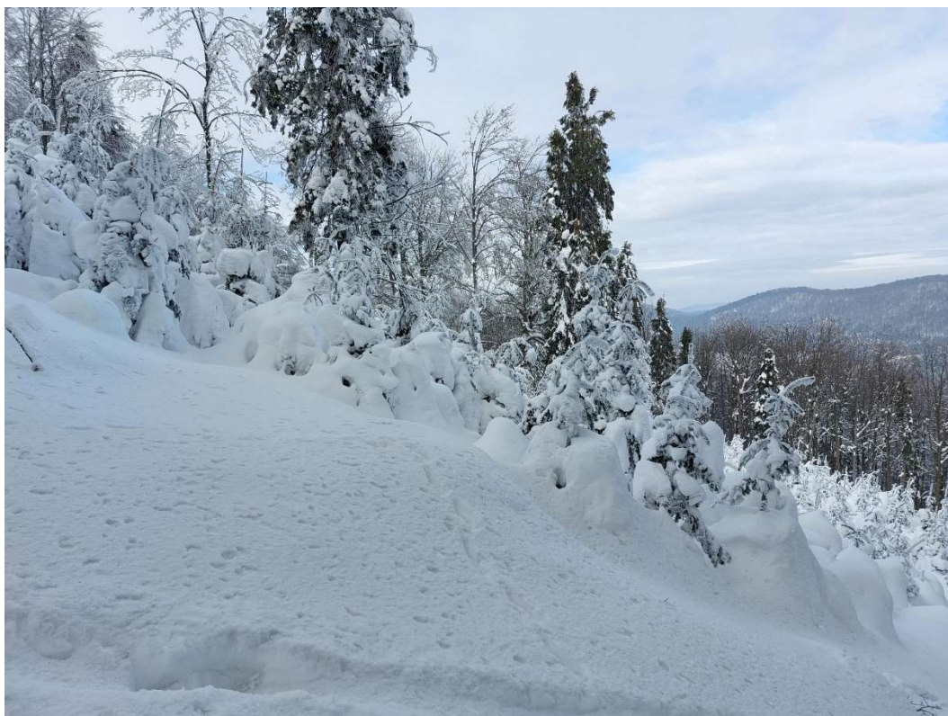
Zima w Beskidzie Niskim, 11.02.2023 r.