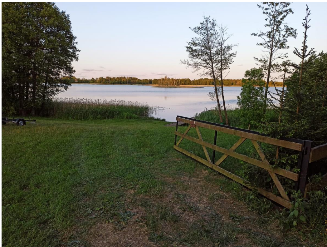
Wiosna nad jeziorem.

W środę, czwartek i piątek pogodnie będzie prawdopodobnie tylko na północnym zachodzie. Na pozostałym obszarze kraju pochmurno i okresami deszczowo. Miejscami, głównie na południu i w centrum, burzom może towarzyszyć intensywny deszcz, porywy wiatru do 60-65 km/h oraz grad. Temperatura w wielu miejscach wzrośnie do 25°C-27°C, tylko nad morzem będzie chłodniej, od 16°C do 20°C. Wiatr będzie okresami porywisty, z kierunków wschodnich.