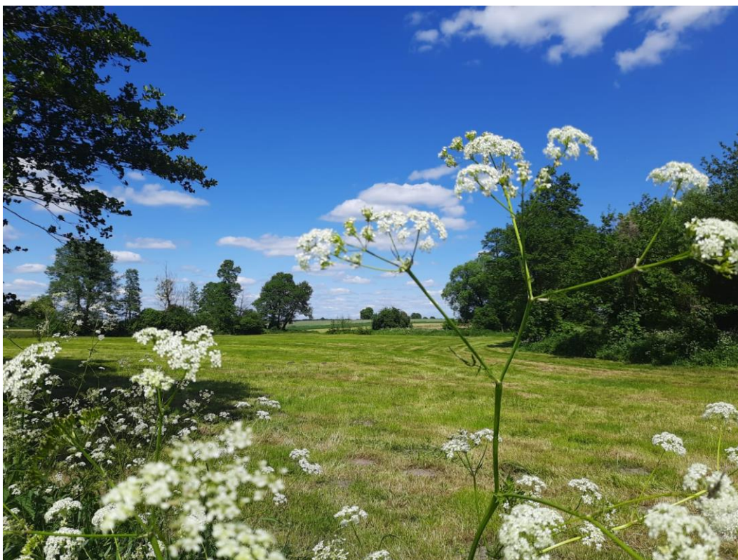
Wiosna na Mazowszu, 03.06.2023 r.